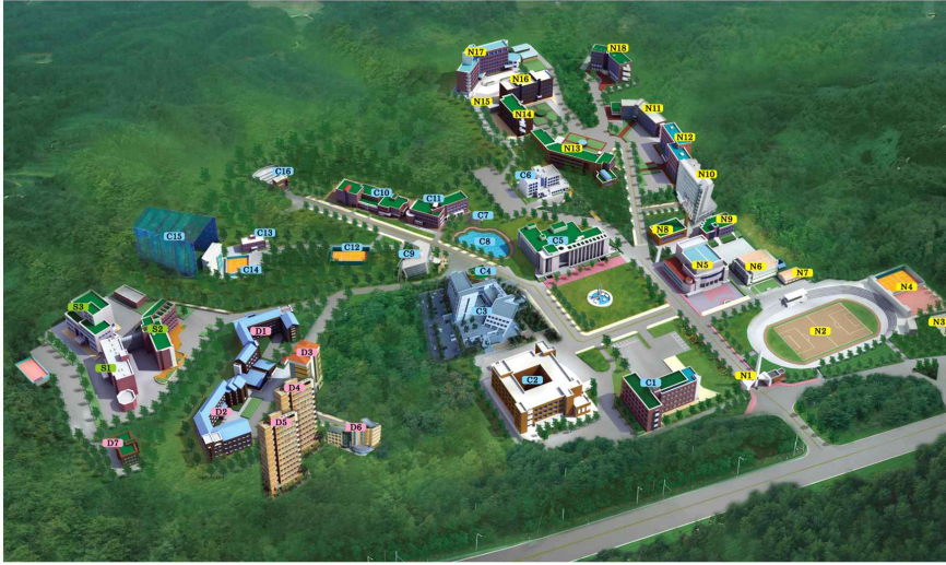
강릉캠퍼스전경 Gangneung Campus