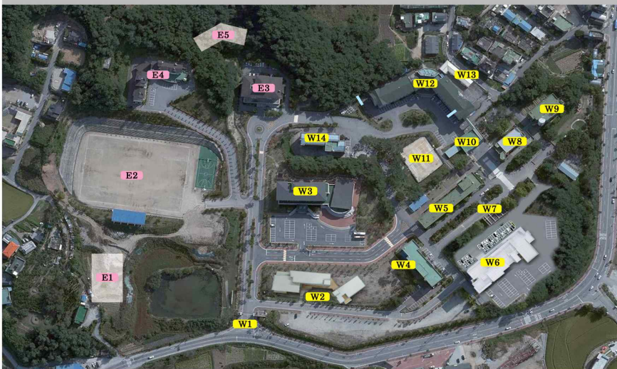
원주캠퍼스전경 Wonju Campus